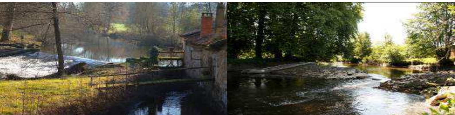
Seuil avant la brèche